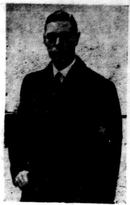
HERTOG VAN YORK jang sekarang menjdijak radja Inggeris mengganti kakandannja.

Djoeja Tuinbouwkundigen Dienst akan berdiri sendiri.